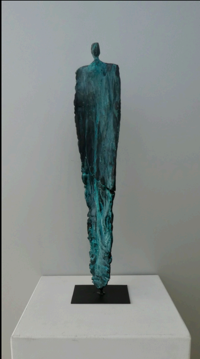
„geerdet“, Keramik, 2018, 50 cm