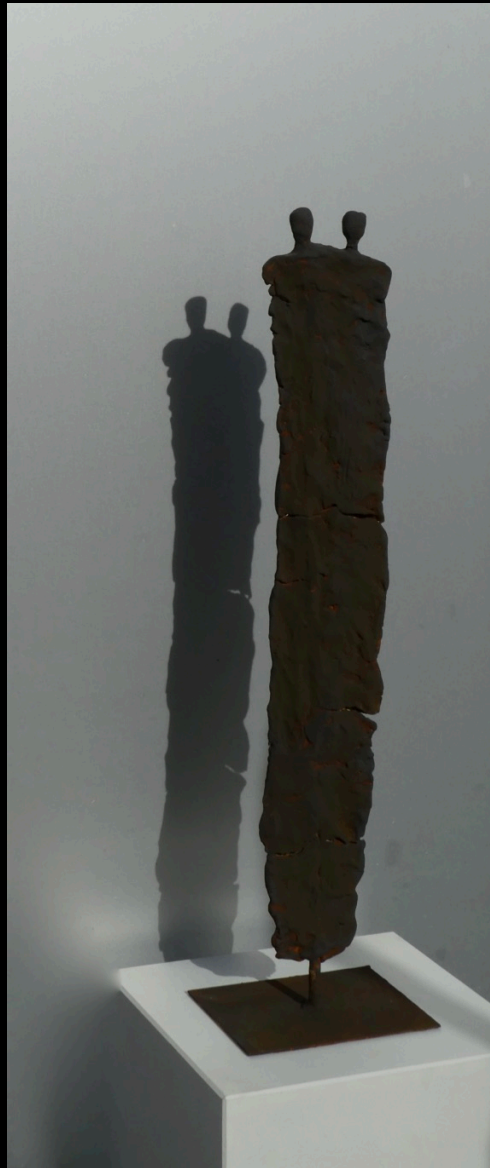
„innig“, Keramik, 2017, 48 cm