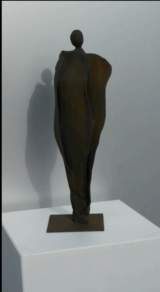
„edle Seide“, Keramik, 2016, 27 cm