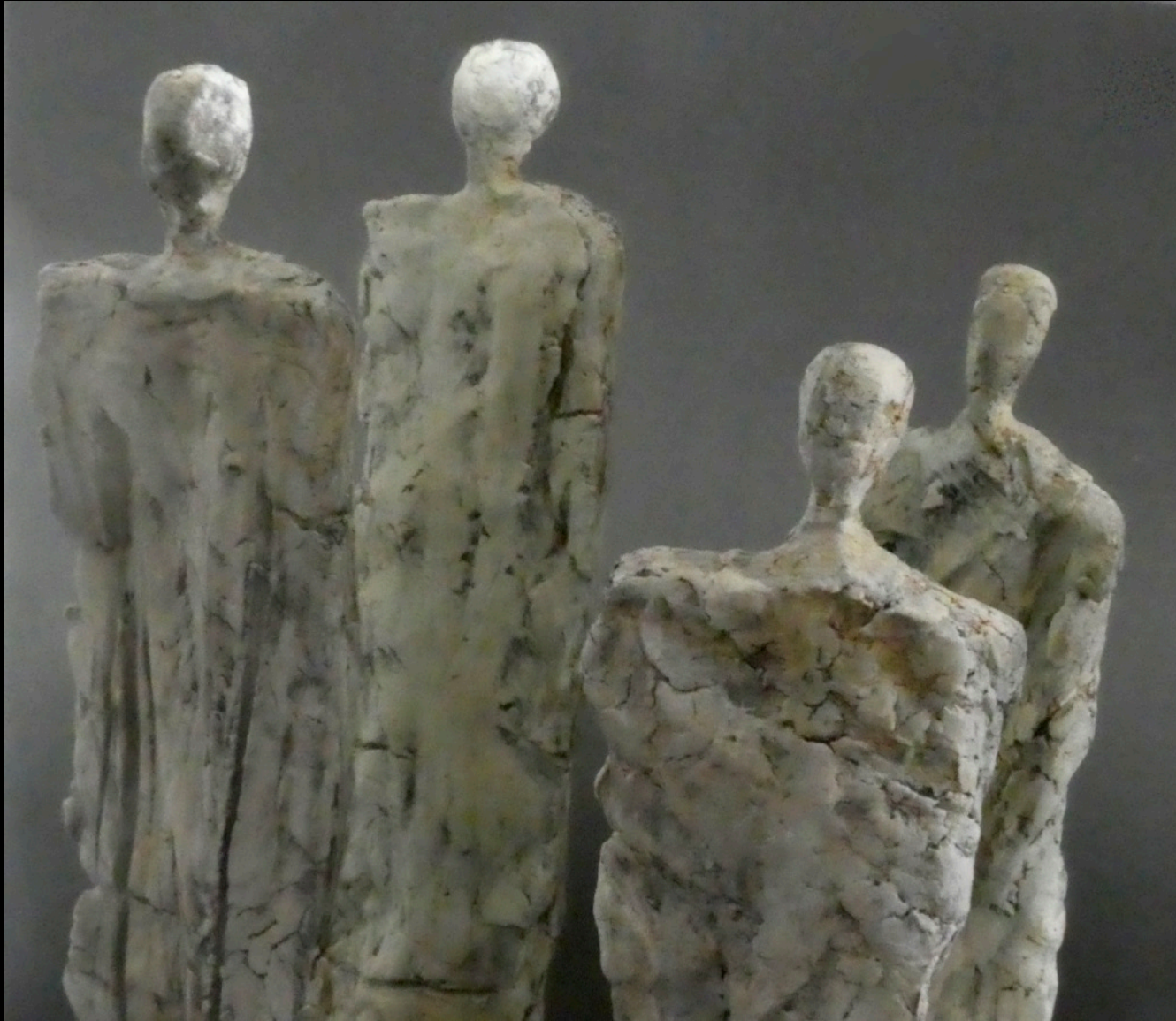
„vis a vis“, Keramik, 2018, 39 cm