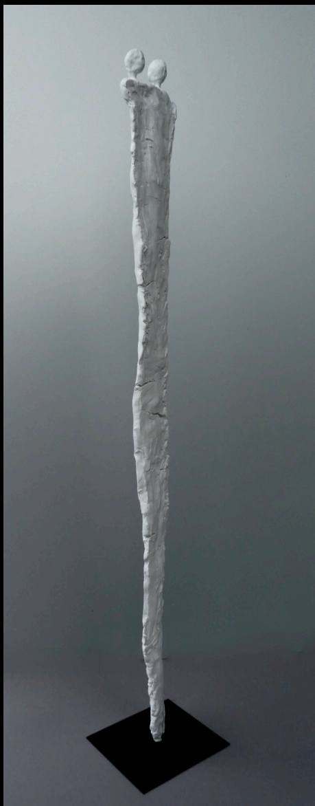
„miteinander“, Keramik, 2017, 94 cm