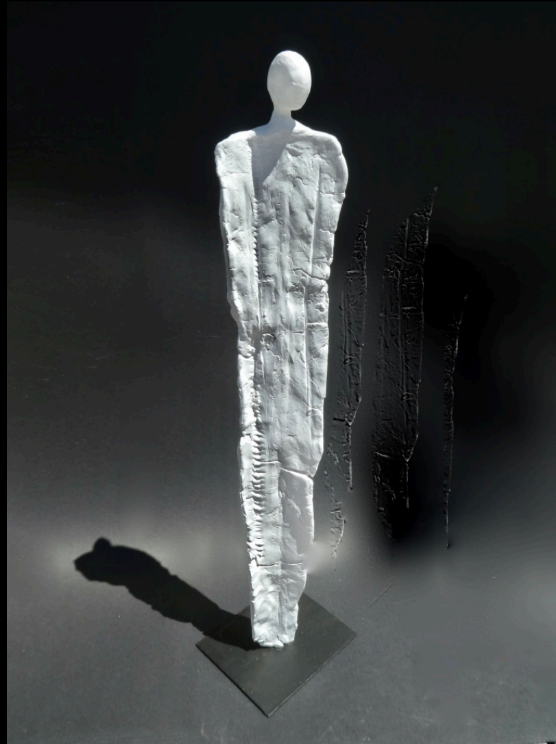
„Der Träumer“, Keramik, 2017, 33 cm