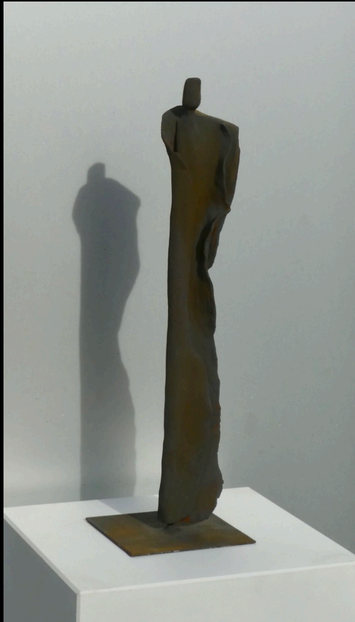
„Prada“, Keramik, 2016, 32 cm