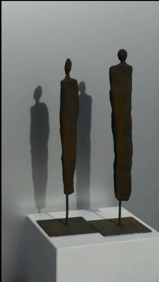
„Frida & Bernd“, Keramik, 2016, 33 cm