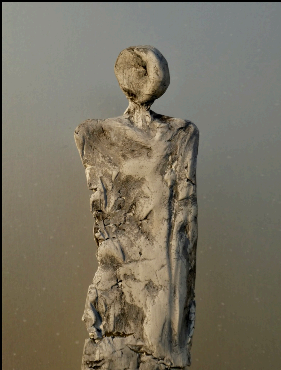
„autonom“, Keramik, 2018, 48 cm