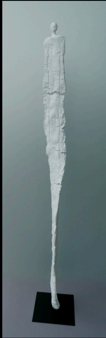
„Fernblick“, Keramik, 2017, 94 cm