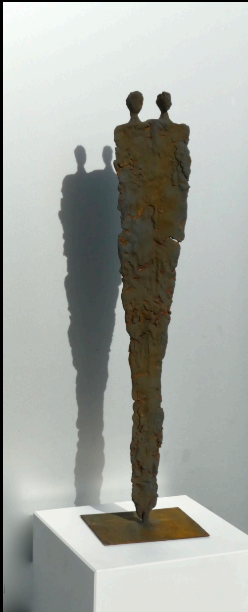
„Glückssträhne“, Keramik, 2017, 48 cm