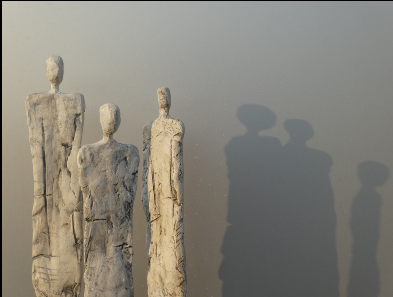
„mitgegangen-mitgefangen“, Keramiik, 2018, 106 cm