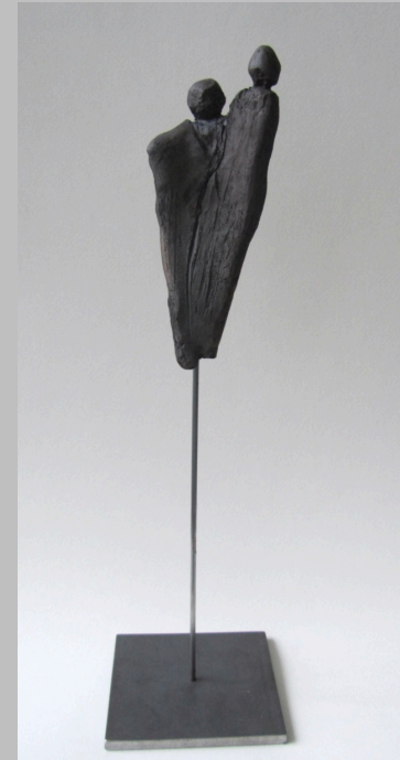
„Neues riskieren“, Ton, 2015, 30 cm