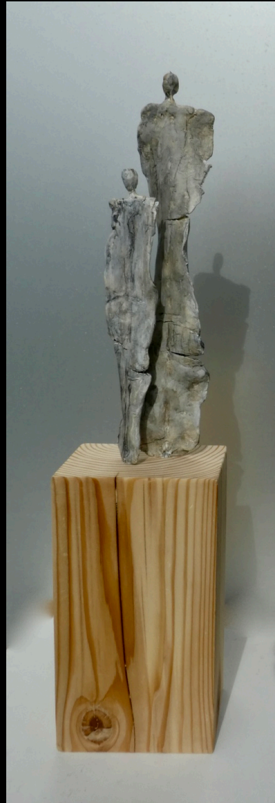
„Generationen“, Keramik, 2018, 11x7x47 cm