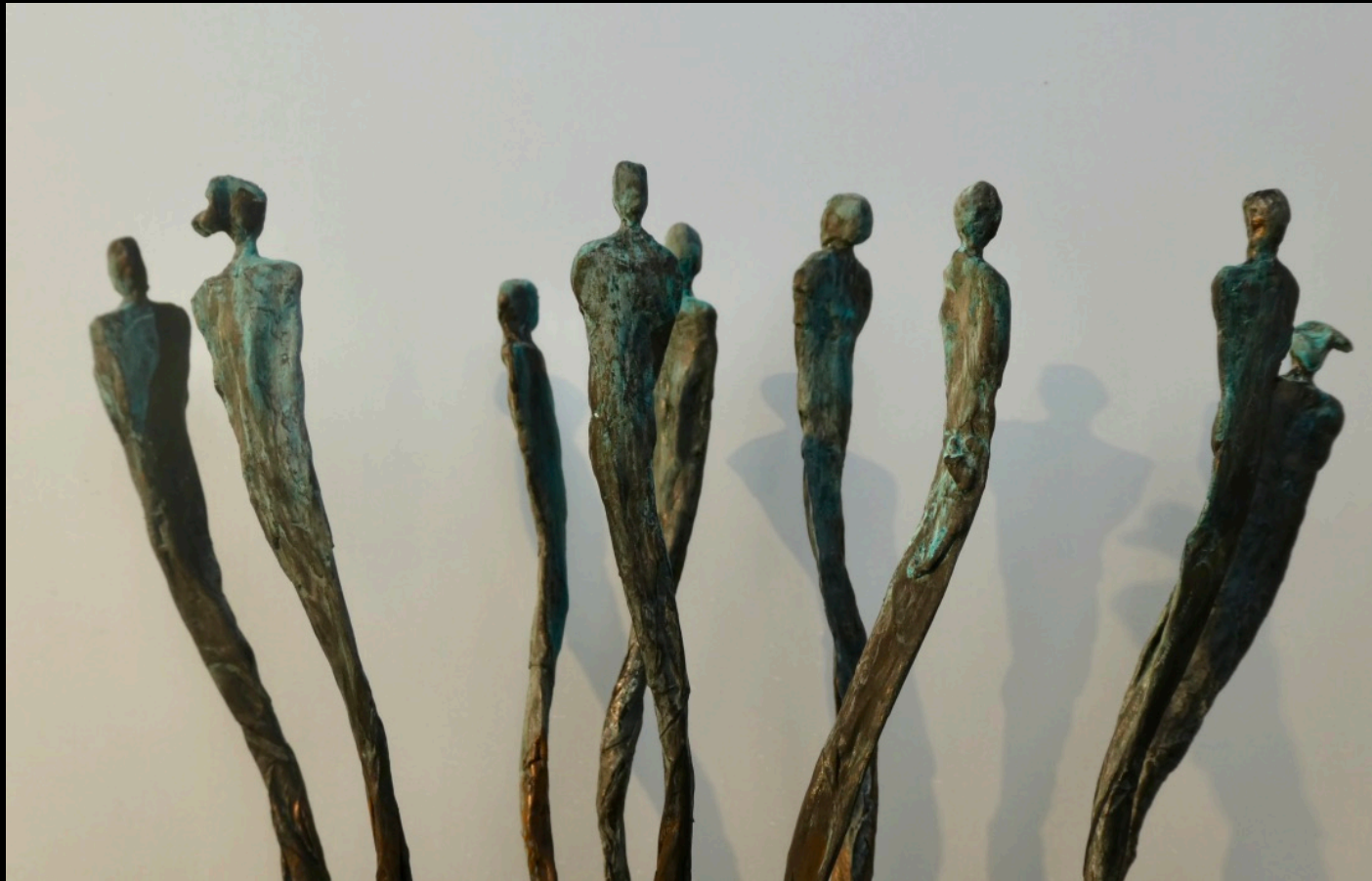
„drifting“, Keramik, 2018, 13x10x39 cm