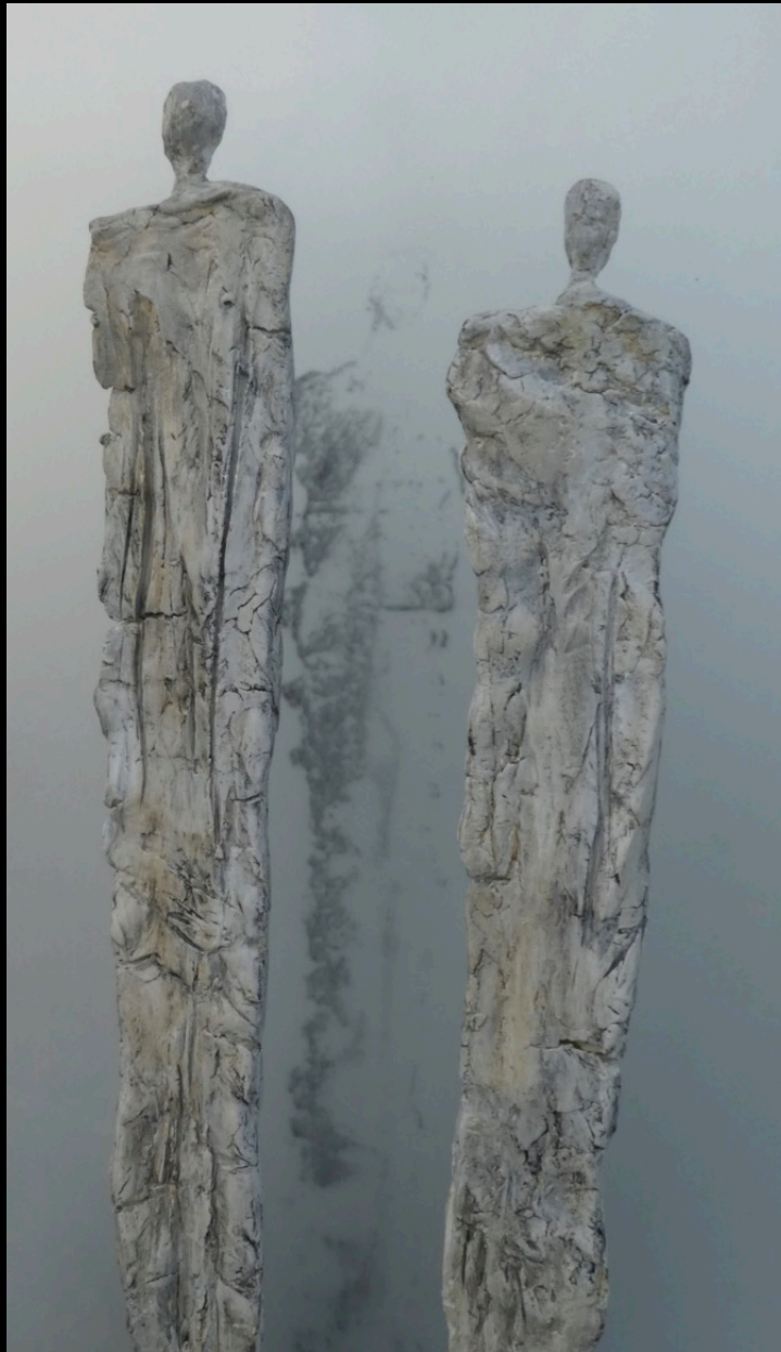
„Blickwinkel“, Keramik/Glas, 2018, 22x6x41 cm