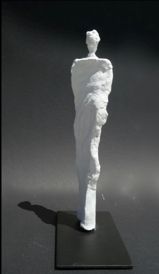
„weibliche Sicht“, Keramik, 2017, 33 cm