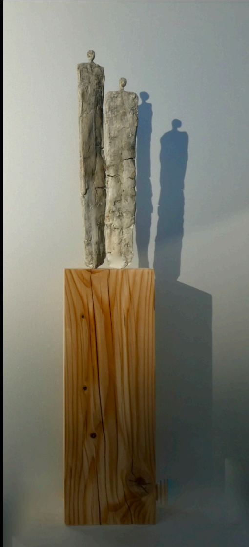
„emanzipiert“, Keramik, 2018, 11x7x58 cm