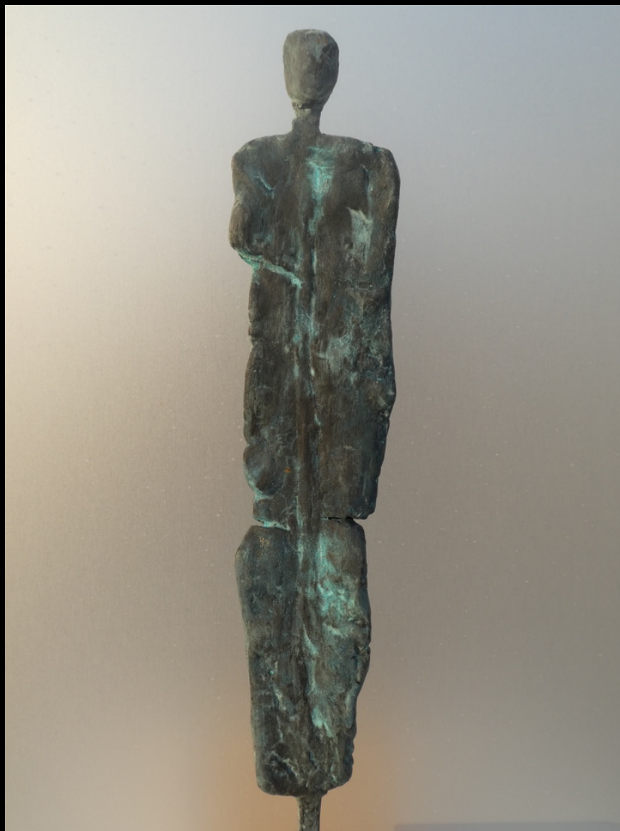
„Zuhörer“, Keramik, 2018, 27 cm