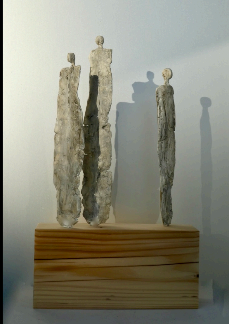
„Trilogie“, Keramik, 2018, 23x7x39 cm