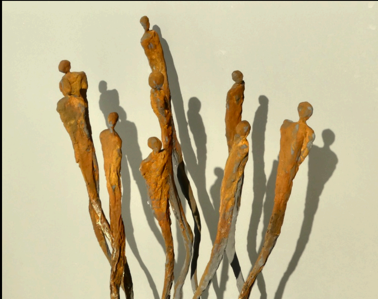
„moving“, Keramik, 2018, 20x15x59 cm