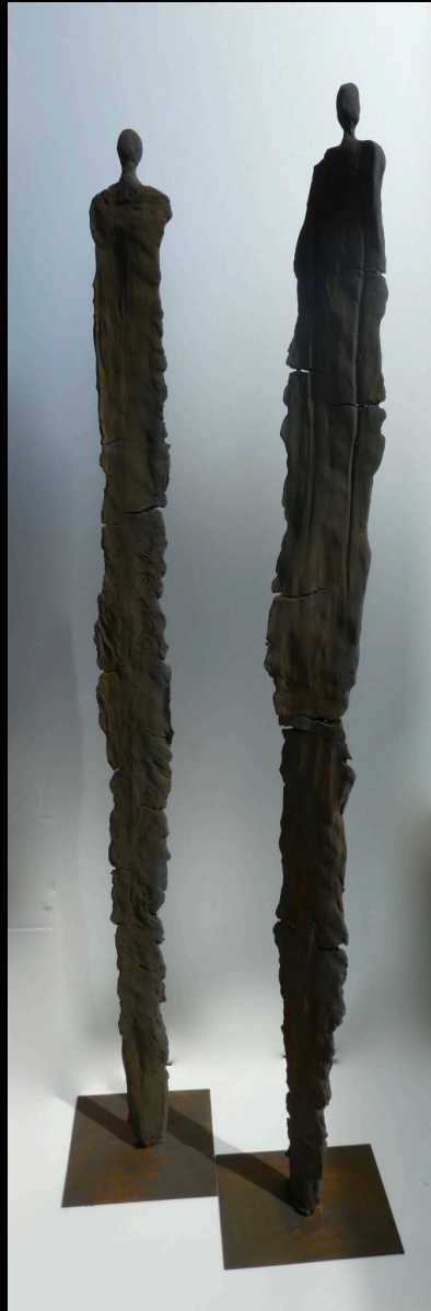
„standfest“, Keramik, 2017, 95 cm