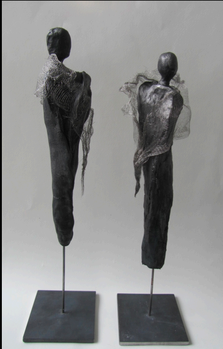
„catwalk“, Ton, 2015, 37 cm