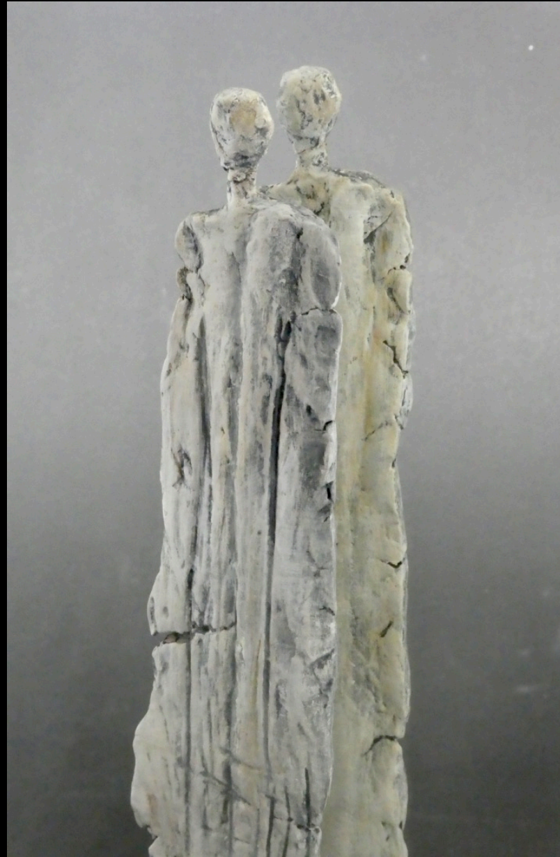
„unerwartet“, Keramik, 2018, 35 cm