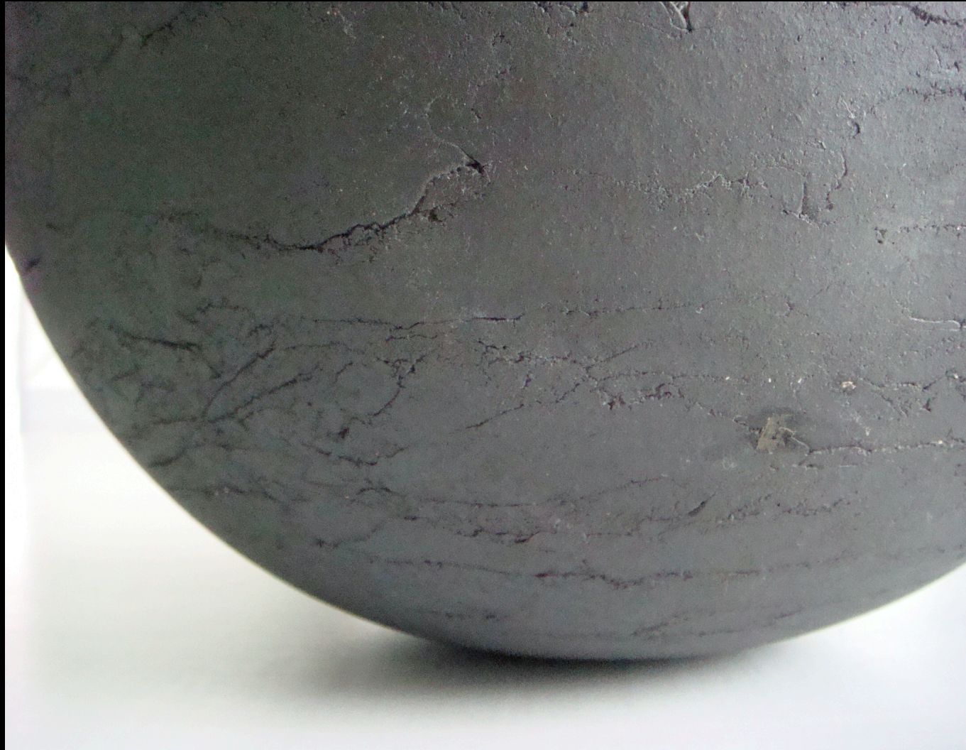
„gerundet“, Ton, 2013, Ø 38 cm